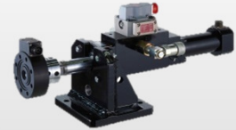
油圧アクチュエータ